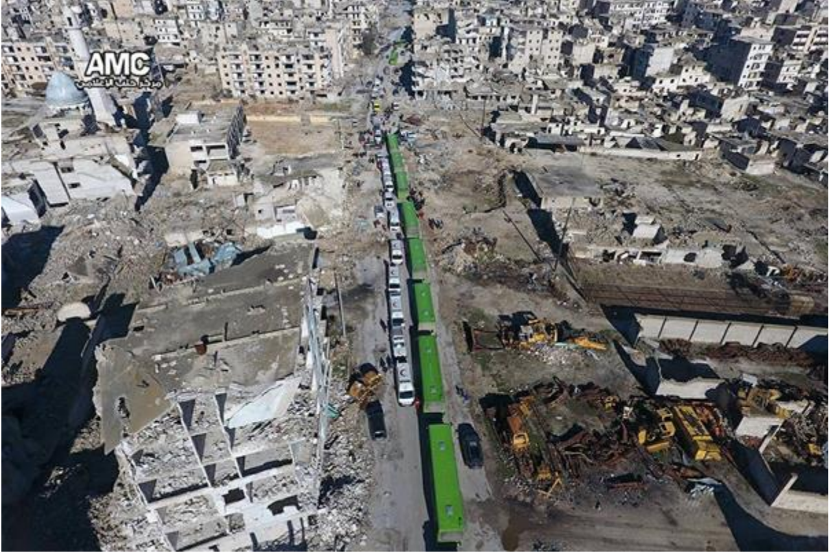
صور لقوافل إجلاء الجرحى من مدينة حلب المحاصرة الى ريف حلب الغربي.