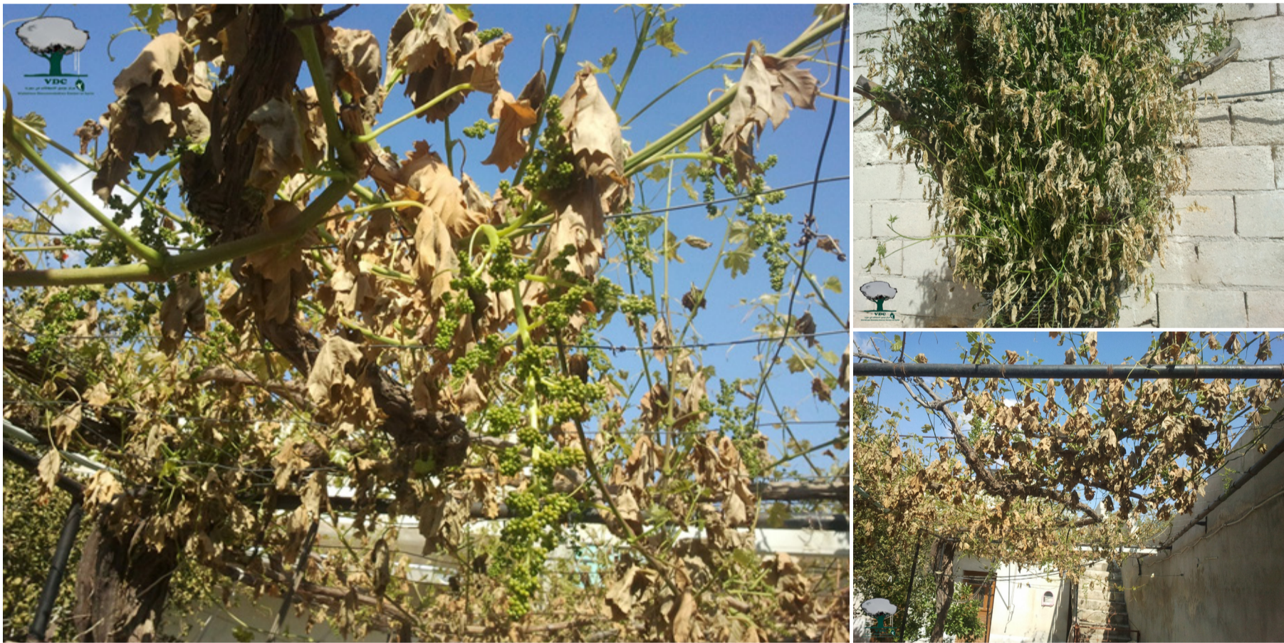
صور تضرر أوراق الشجر من غاز الكلور