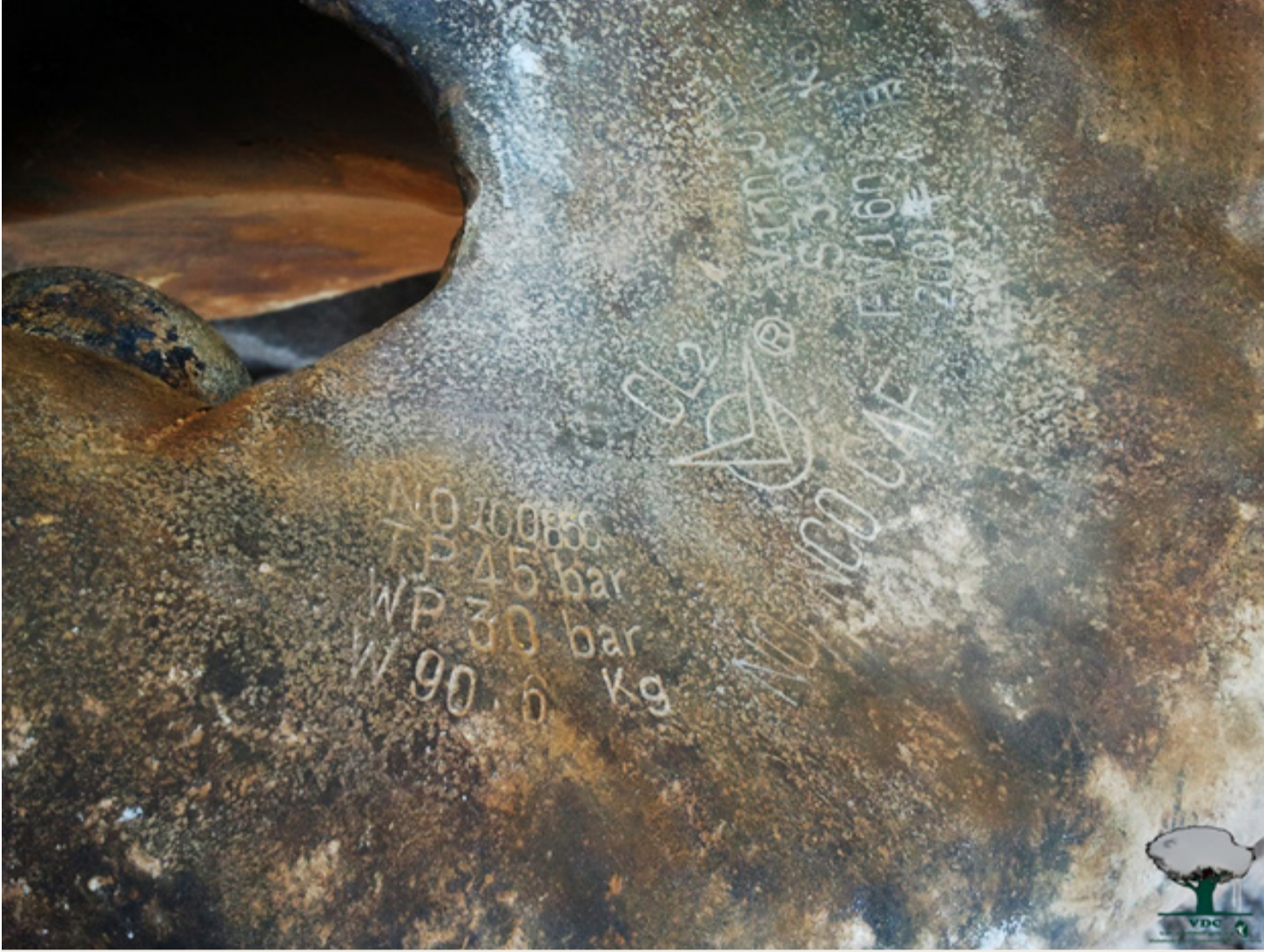
ويظهر اسم شركة نورينكو الصينية ورمز غاز الكلور الكيميائي على البرميل