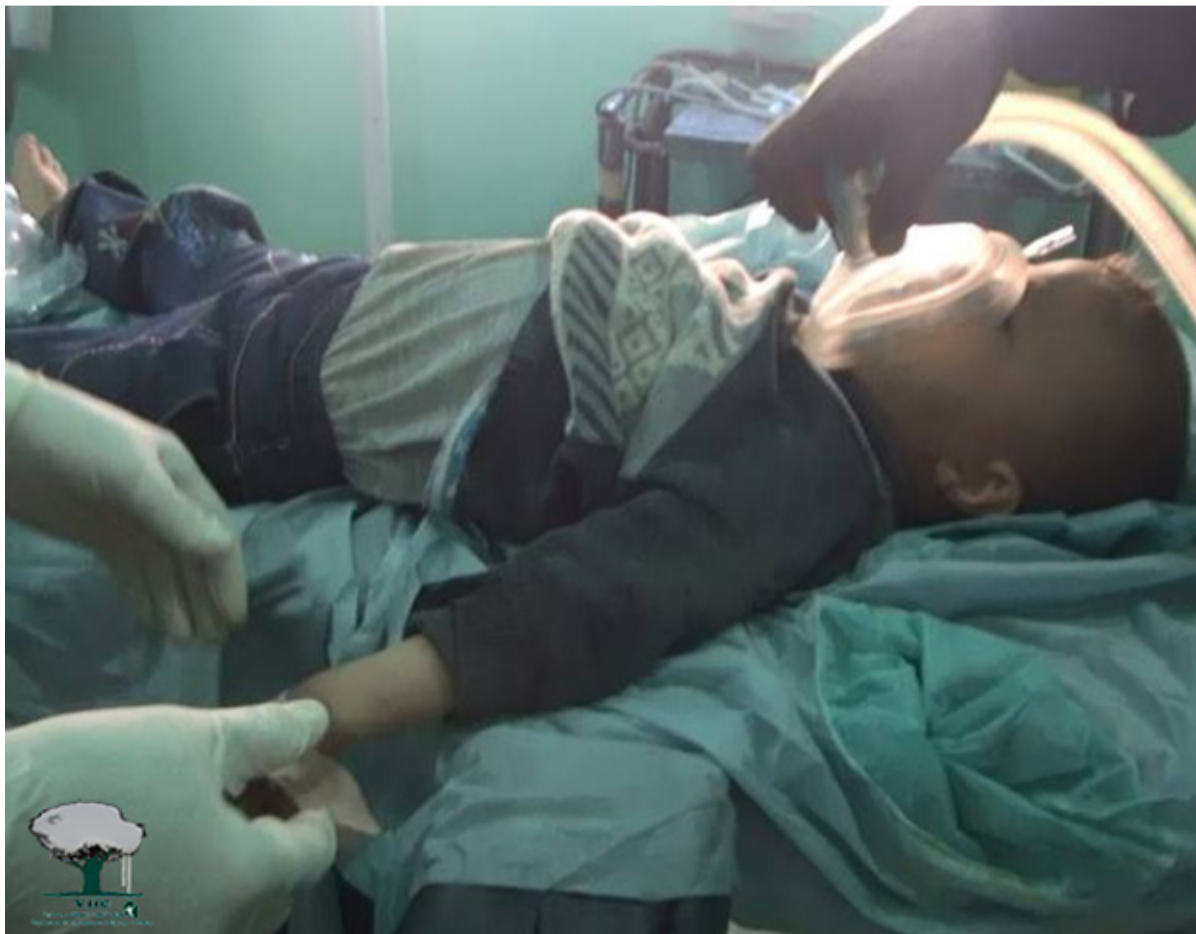
صورة طفل مصاب مشفى تلمنس 2014-04-21