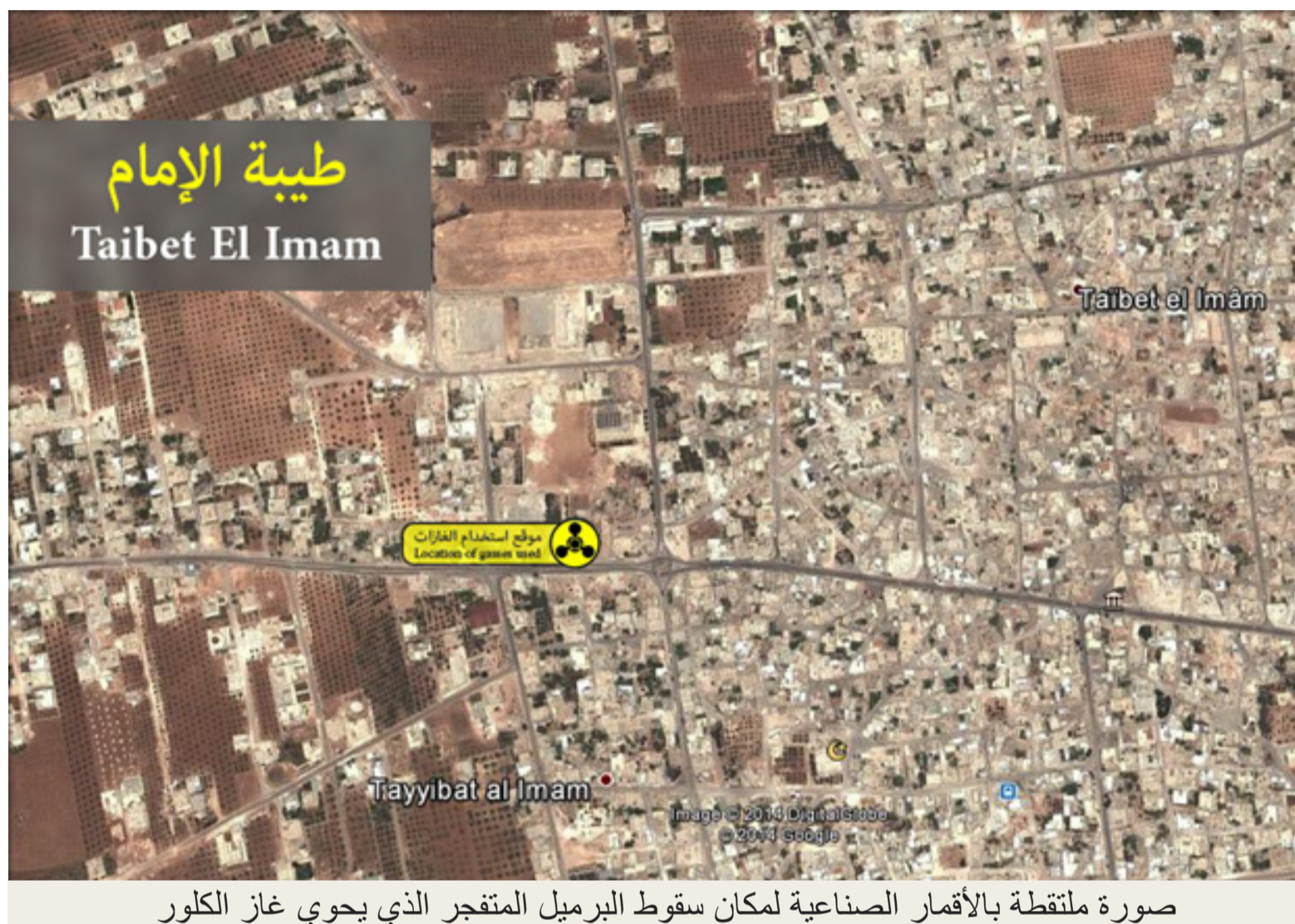
صورة ملتقطة بالأقمار الصناعية لمكان سقوط البرميل المتفجر الذي يحوي غاز الكلور